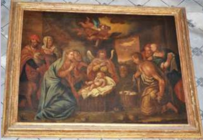
ADORAZIONE DEI PASTORI – Chiesa S.Maria dei Giardini – vill. S.Stefano Medio (ME)

Opera di anonimo con influssi stilistici ricollegabili all'esperienza dei pittori lombardi della prima metà del secolo XVII.